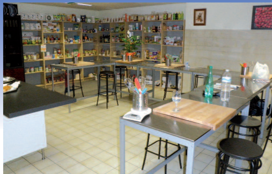
Une cuisine spacieuse et fonctionnelle...et sa bibliothèque alimentaire

Cuisiner sans gluten et sans lait, est avant tout un changement d'habitude qui ne doit en rien altérer le plaisir de manger et l'équilibre nécessaire à une bonne alimentation. Il permet la découverte de nouvelles saveurs, pour des repas variés remplis de fantaisie et d'originalité dans une ambiance chaleureuse et ludique.